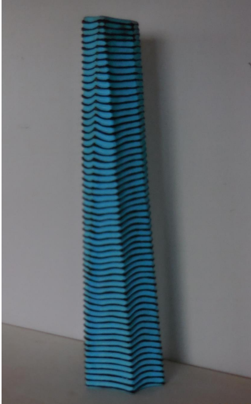
Hellblaues, geripptes Standobjekt, o. T., Lindenholz und Farbe, 2015, 39 x 8,5 x 7,2 cm