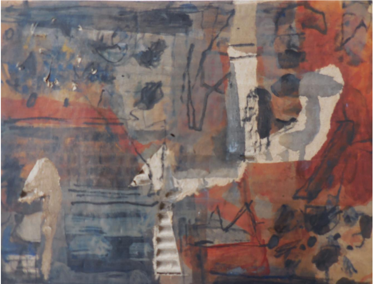
Acrylic on paper Untitled. 2016

1957. Lives and works in Germany & India.